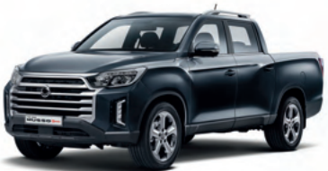
Yeni Galaksi Gri