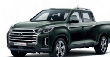
Yeni Amazon Yeşili

Görseller ve donanımlar farklılık gösterebilir.